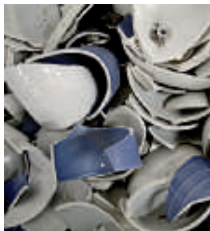
Skånes keramikcentrum i kras efter ett sekel.

– Det var redan bestämt, de skulle börja förhandla med facket, säger Eivor Wulff. Vad ska man göra? Det blev rätt tyst.