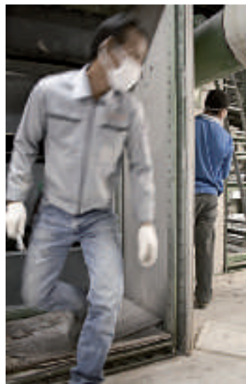
En del av maskinerna flyttar till Thailand och skruvas ner bit för bit. Brännugnarna söker en ny ägare.